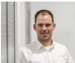
Christian Degler Technische Beratung

Gern beraten wir Sie zu den verschiedenen Produkten und Lösungen, die auf Ihren Einsatzbereich zugeschnitten sind. Gleich unseren Berater kontaktieren und einen Präsentationstermin in Ihrem Hause vereinbaren. Wir freuen uns auf Ihren Anruf oder Ihre Anfrage per Mail!